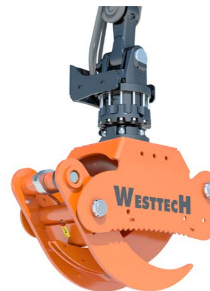
Grappin puissant à 3 doigts