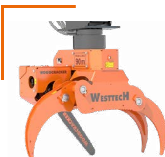
Scie avec diamètre de coupe de 54 cm (WG1270)