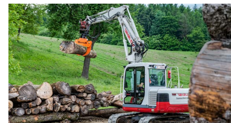
Montage rigide ou cardanique.