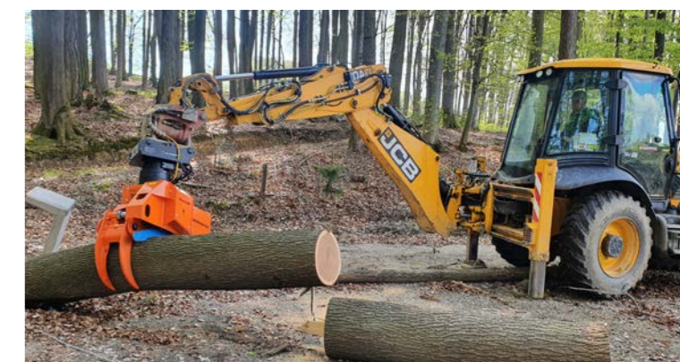
Grappin à bois, robuste et à faible usure.