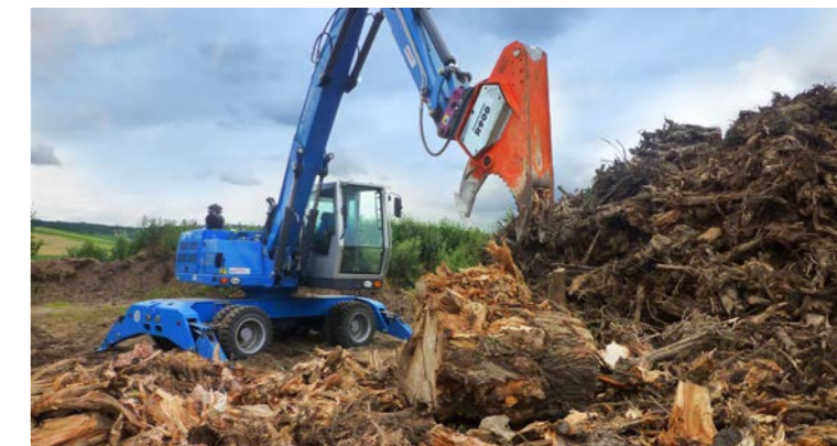
Idéal pour nettoyage du sol.