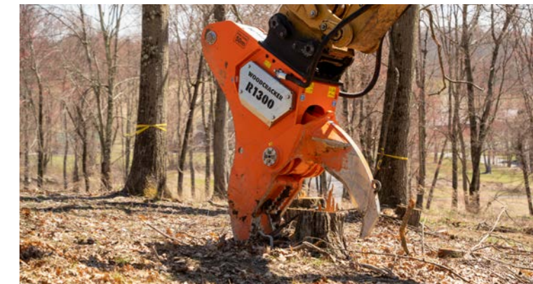
Système de coupe robuste.