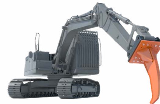
Woodcracker® Dent Dessouchage