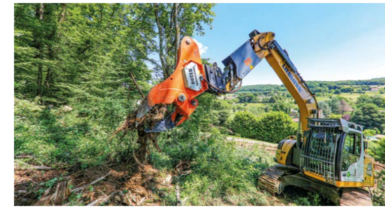
Elimination des souches en ménagant le sol.