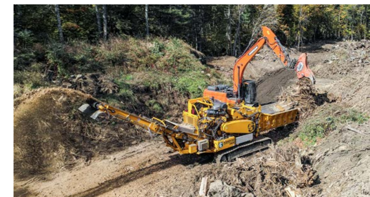
Mettre en petits morceaux le matériel récolté.

Caractéristiques techniques et illustrations sans engagement. Le constructeur se réserve le droit de modifications dans l'intérêt du développement du produit.