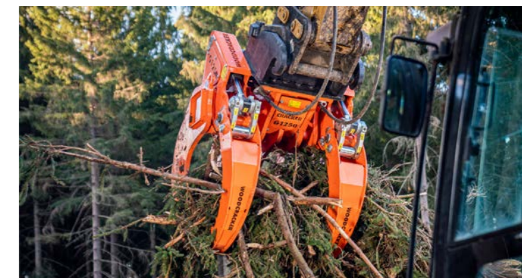
Très grande capacité.