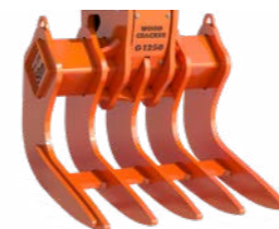
Woodcracker® G sans bras grappin