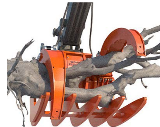
Adaptation individuelle des deux doigts du grappin au poutre de la récolte.