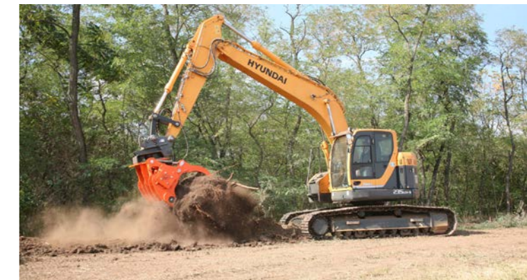
Nettoyage et entretien des grandes surfaces.