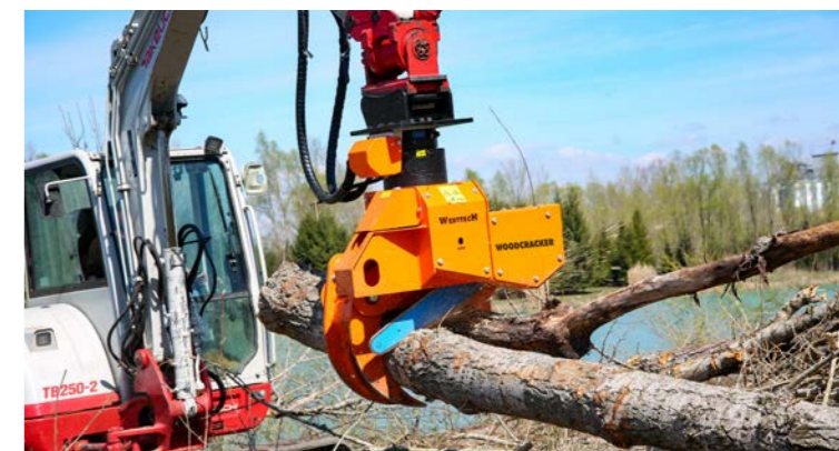
Kann am Kran, Rückewagen oder Bagger angebaut werden.