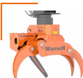
Säge mit 54 cm Schnittdurchmesser beim WG1270