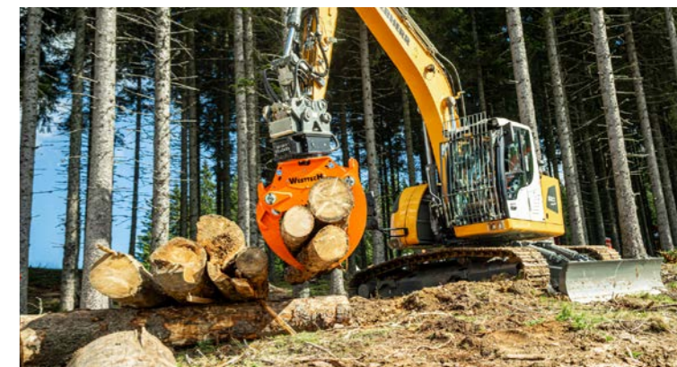
Greiferöffnung bis zu 1720 mm.