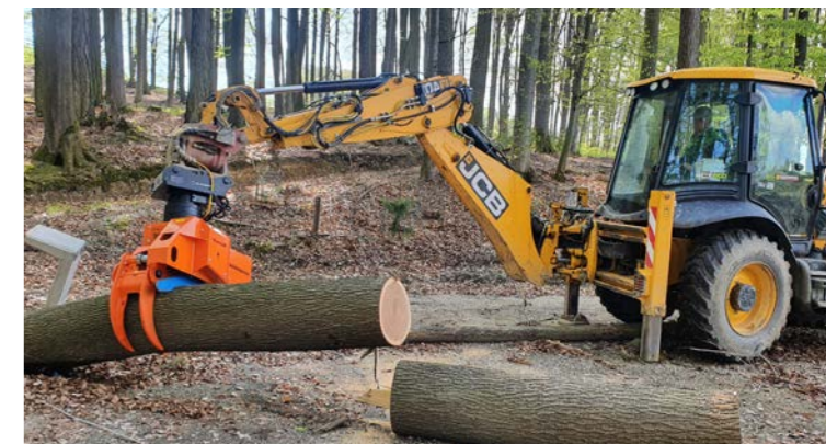
Robuster und verschleißbarer Holzgreifer, inkl. Säge.