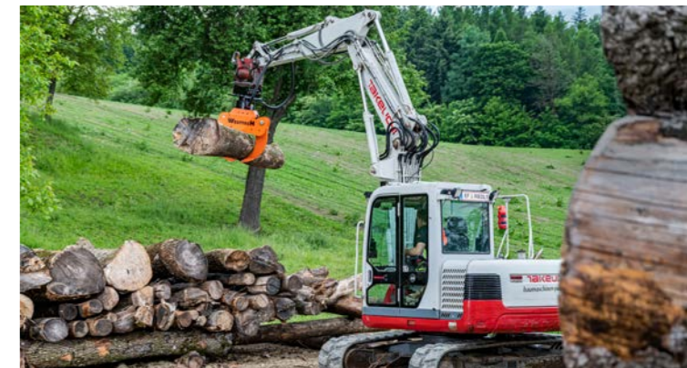
Starrer oder kardanischer Anbau möglich.