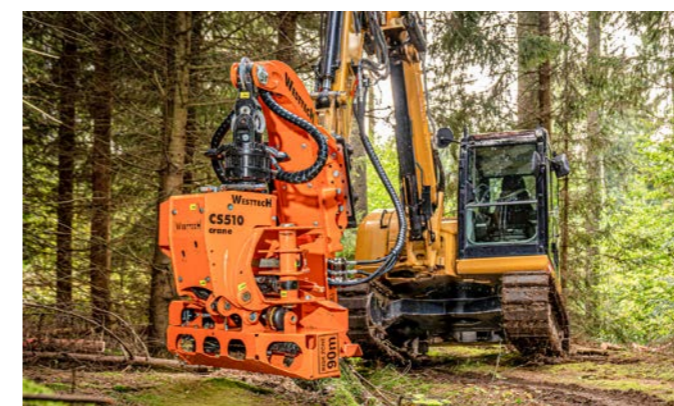
Der Schreitfuß ermöglicht dem Bagger sich abzustützen, wenn kardanische Geräte angebaut sind.