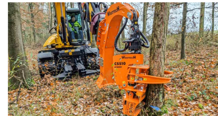
Schreitfuß mit Woodcracker® CS510 crane.