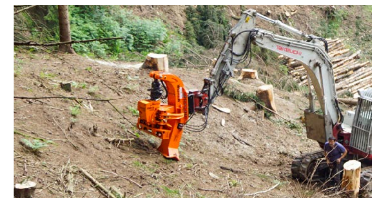
Zur Fortbewegung im unwegsamem Gelände.