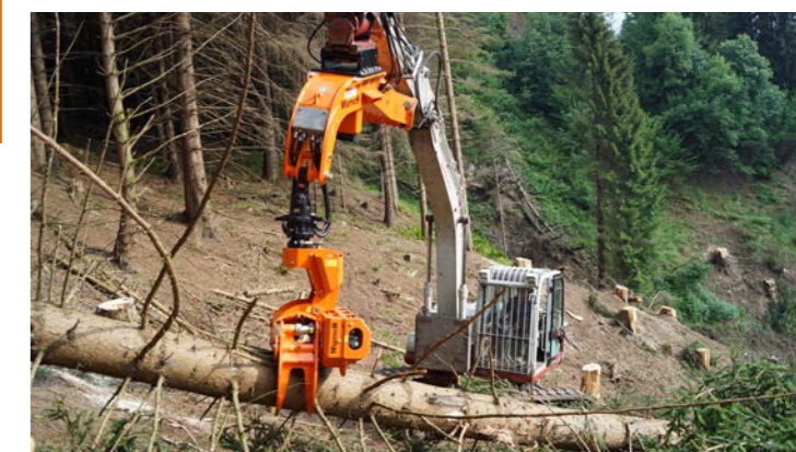
Zur Durchforstung in Hanglagen.