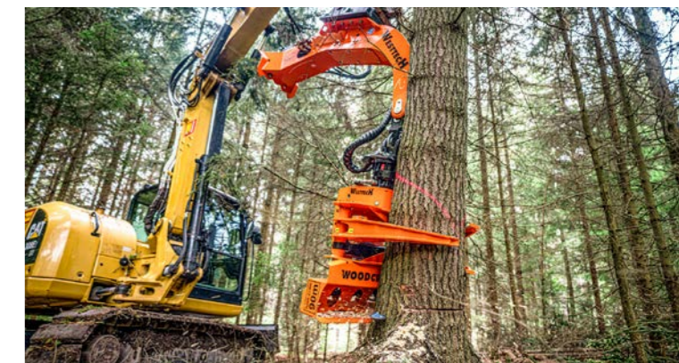
Für alle handelsüblichen Bagger.