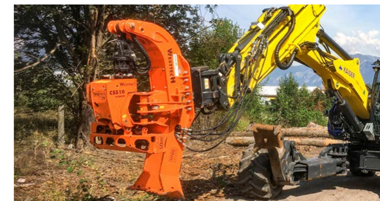
Schreitfuß am Schreitbagger Kaiser S12.