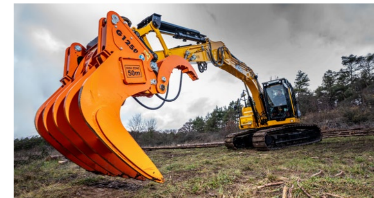
Adatto a tutte le macchine operatrici comuni.