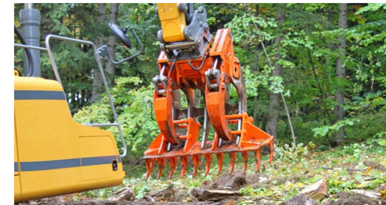
Woodcracker® G1250 con rastrello a denti fitti.