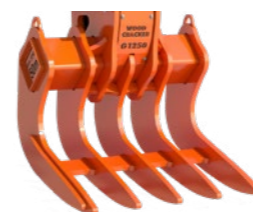
Woodcracker® G senza dita prensili.